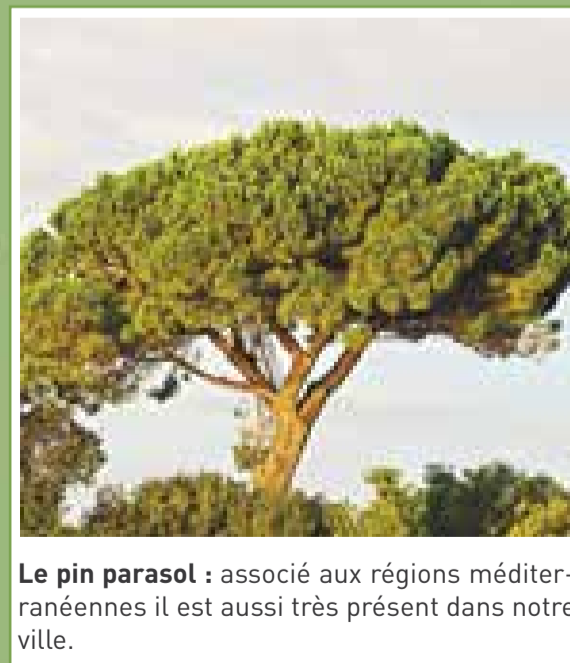
Le pin parasol : associé aux régions méditerranéennes il est aussi très présent dans notre ville.