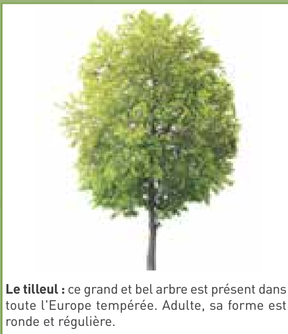
Le tilleul : ce grand et bel arbre est présent dans toute l'Europe tempérée. Adulte, sa forme est ronde et régulière.