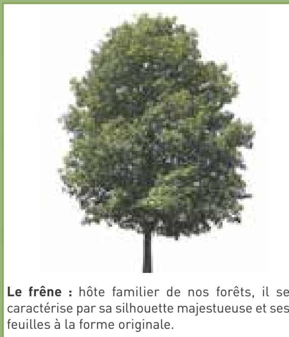
Le frêne : hôte familier de nos forêts, il se caractérise par sa silhouette majestueuse et ses feuilles à la forme originale.