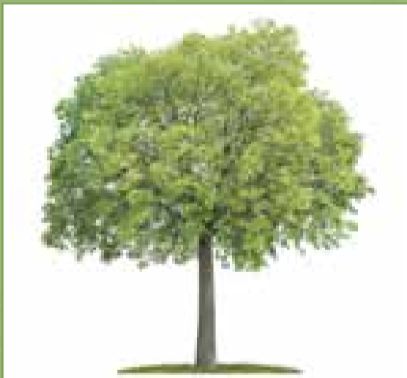
Le micocoulier : cet arbre majestueux et élégant est rencontré fréquemment dans notre environnement. Il séduit par sa belle silhouette.