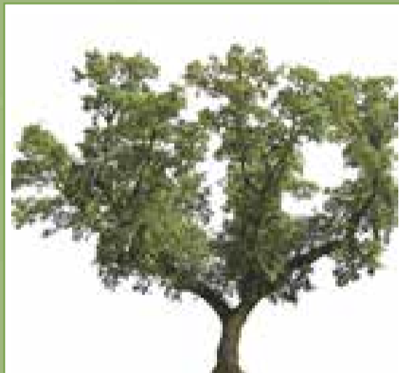
Le chêne vert : cette essence appréciée pour son joli feuillage persistant est très présente dans notre région.